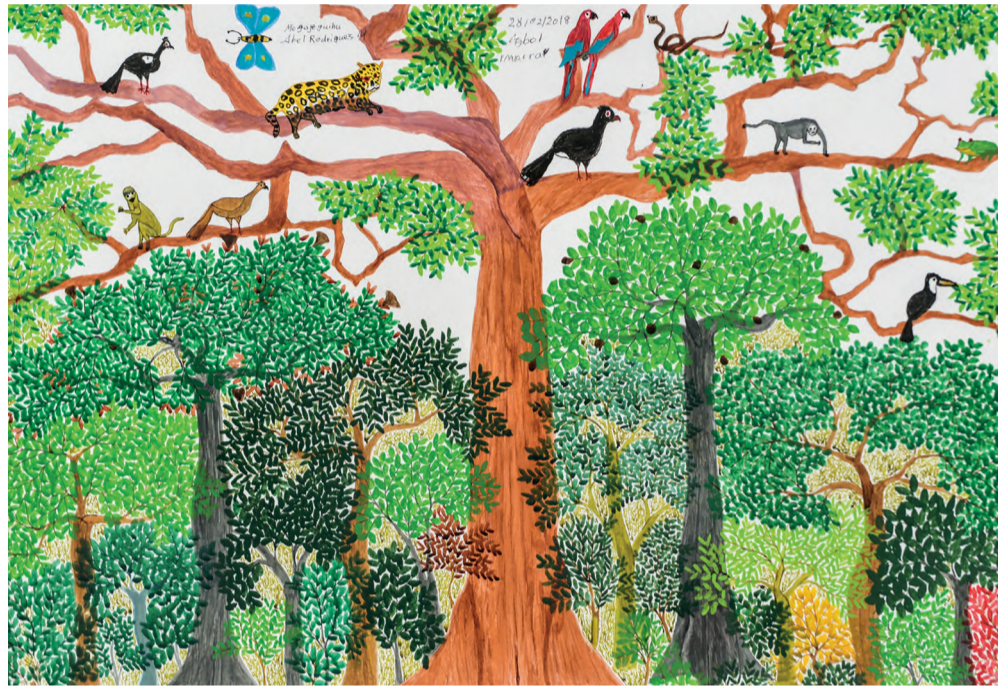
Imagen 2. Portada y contraportada. Revista de la Universidad de México , 847 (abril 2019).

Debe destacarse que del total de autores del dossier, todos pertenecen a alguna comunidad indígena con excepción de cinco, que son académicos o escritores sin una relación directa con estas etnias. Así, hay representantes de las comunidades mixe, maya, tsotsil, kul wikasa, kichwa, chontal, mixteca, mapuche, zoque y dule. Aunado a ello, de las 170 páginas que componen el número, 132 guardan relación con el tema del dossier. Por último, la ilustración del ejemplar, que abarca portada y contraportada, es del artista indígena de la Amazonia colombiana, Abel Rodríguez Muinane.