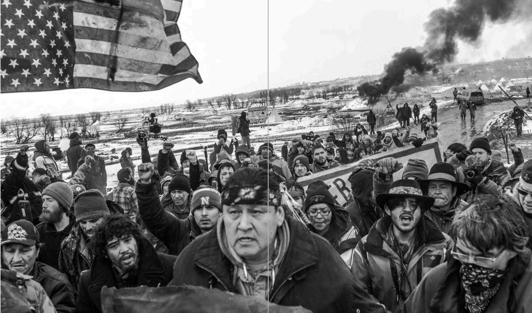
Imagen 6. Comunidad de Abya Yala . Revista de la Universidad de México , 847 (abril 2019): 126-127. Recuperado de https://acortar.link/18Qlk0

Al respecto, cobra importancia que una de las preguntas que realiza la Redacción de la revista a Patricia Gualinga busque una confirmación a un discurso progresista o políticamente correcto: