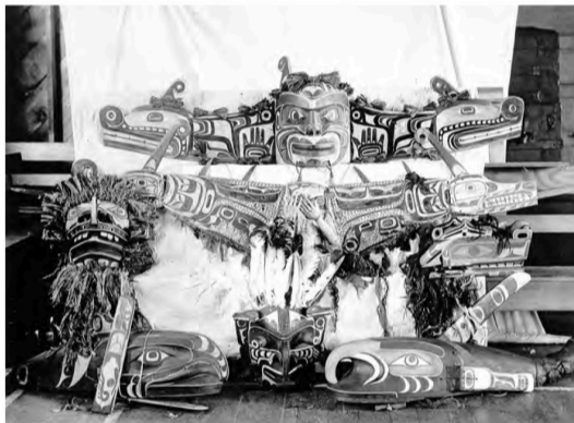
Imagen 2. Máscaras ceremoniales indígenas, Bahía Alert, Columbia Británica, fecha desconocida. Royal BC Museum and Archives, Victoria.